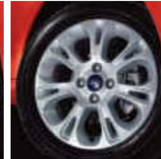
Llanta de aleación de 15" de 7x2 radios (Disponible como Accesorio)