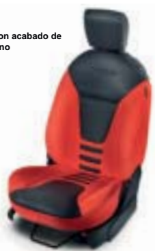
Tela en Rojo con acabado de Fibra de carbono (Grand Prix II)