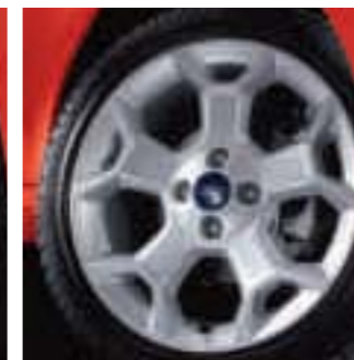
Llanta de aleación de 16" de 5 radios de diseño Y (Opcional en Titanium+, de serie en Black Edition y Accesorio)