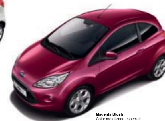
Magenta Blush Color metalizado especial*

*El color blanco Crystal, los colores metalizados y especiales son opciones con coste adicional.