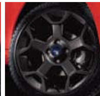
Llanta de aleación de 16" 5 radios de diseño Y en negro (Opción en Black Edition y de serie en Grand Prix II)