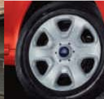
Embellecedor de 14" (De serie en Urban)