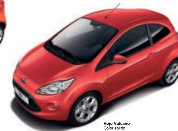
Rojo Vulcano Color sólido