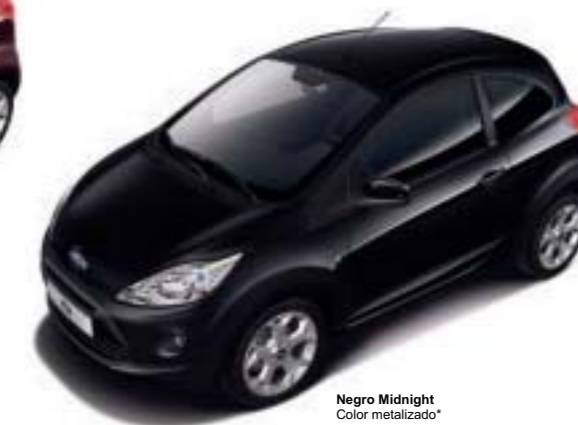
Negro Midnight Color metalizado*