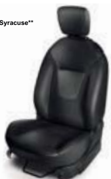
Cuero en Gris Syracuse** (Titanium+)