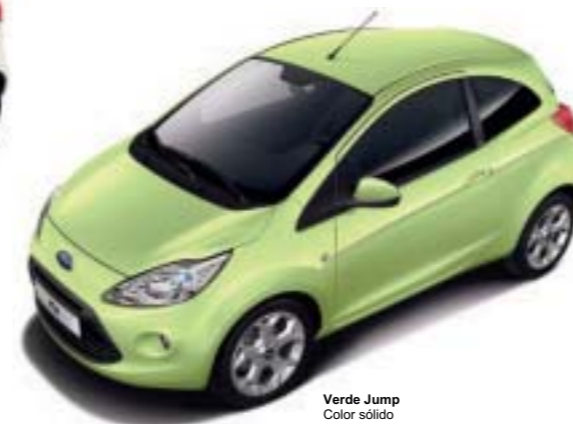
Verde Jump Color sólido