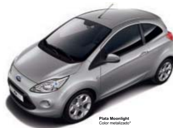
Plata Moonlight Color metalizado*