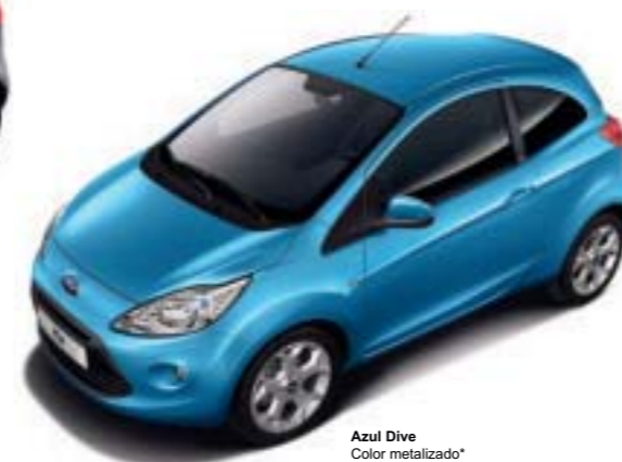
Azul Dive Color metalizado*