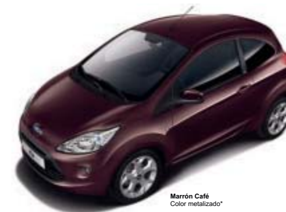
Marrón Café Color metalizado*