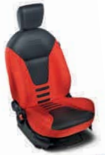
Asientos con tapicería exclusiva Grand Prix en rojo con inserciones de diseño fibra de carbono

*Grand Prix II sólo está disponible con color exterior rojo Sunrise.