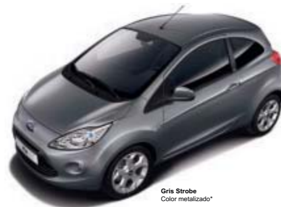
Gris Strobe Color metalizado*