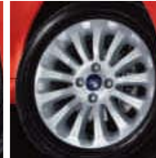
Llanta de aleación de 15" de radios múltiples (De serie en Titanium+, Accesorio)