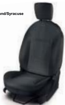
Tela Gris Fairland/Syracuse (Titanium+)