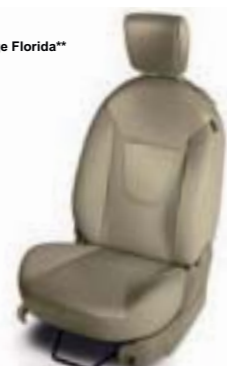
Cuero en Beige Florida** (Titanium+)