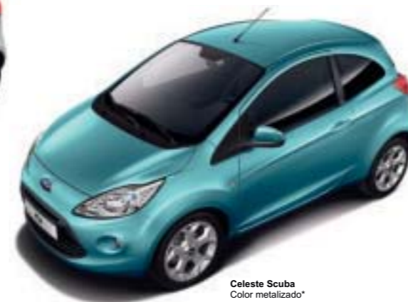
Celeste Scuba Color metalizado*