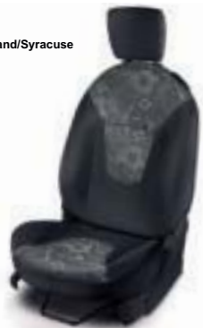
Tela Gris Fairland/Syracuse (Urban)