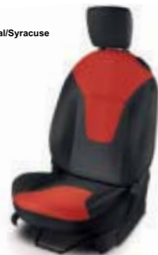
Tela Rojo Coral/Syracuse (Titanium+)