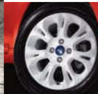
Llanta de aleación de 15" 7x2 radios en blanco (Disponible como Accesorio, c.f.: 1554416)