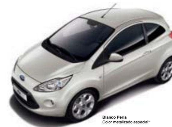
Blanco Perla Color metalizado especial*