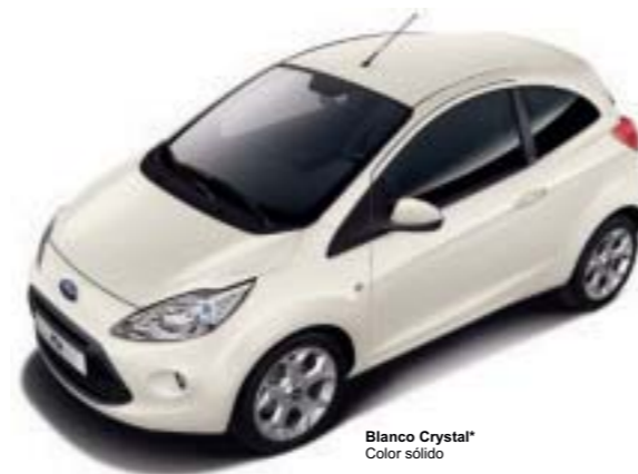
Blanco Crystal* Color sólido