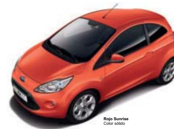
Rojo Sunrise Color sólido